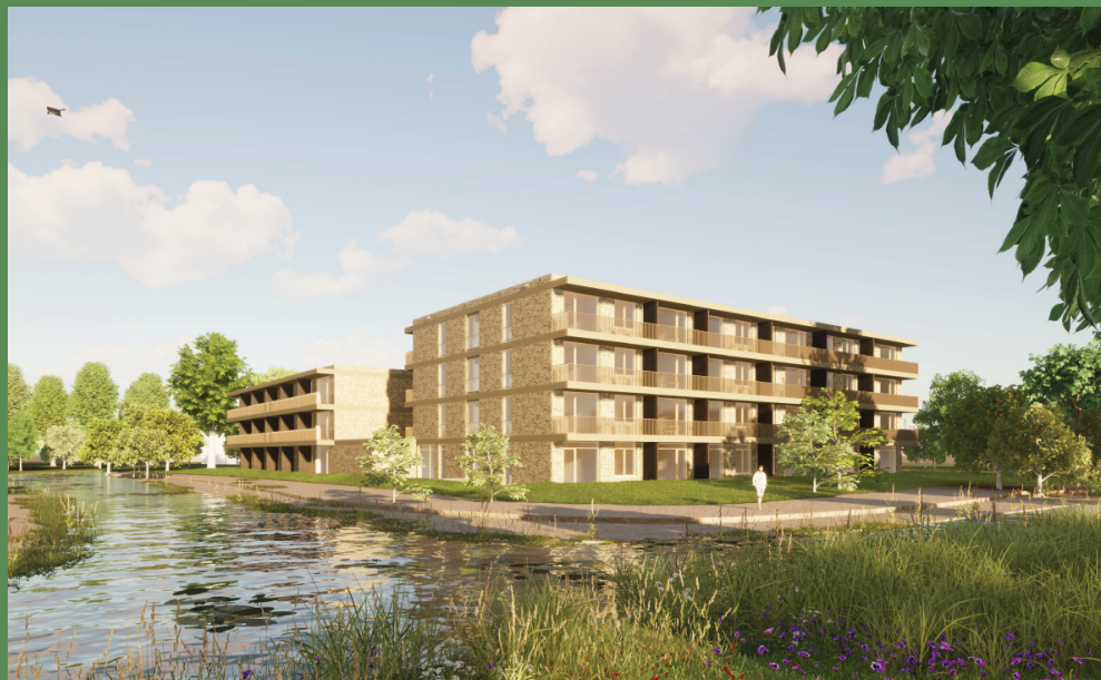
Voorlopige impressie door KAW.Architecten

Wellicht heeft u gemerkt dat we al begonnen zijn met de voorbereiding van de bouw van de eerste twee woongebouwen. Beide bouwlocaties zijn uitgebreid ingemeten, inclusief de plaats van alle bestaande bomen. Op deze manier kunnen we de definitieve positie van de gebouwen exact bepalen met behoud van zoveel mogelijk bomen. Ook onderzoeken we bijvoorbeeld de kwaliteit van de bestaande rioleringen in het gebied en het verloop van de ondergrondse kabels en leidingen. Voordat Arcade kan starten met de bouw worden de bouwlocaties door Parnassia Groep bouwrijp gemaakt: ondergrondse kabels en leidingen worden verwijderd en waar bomen in de weg staan, worden deze gekapt. Voor het laatste is een Omgevingsvergunning van de gemeente nodig. Zoals hierboven vermeld, is de procedure hiervoor in december opgestart.